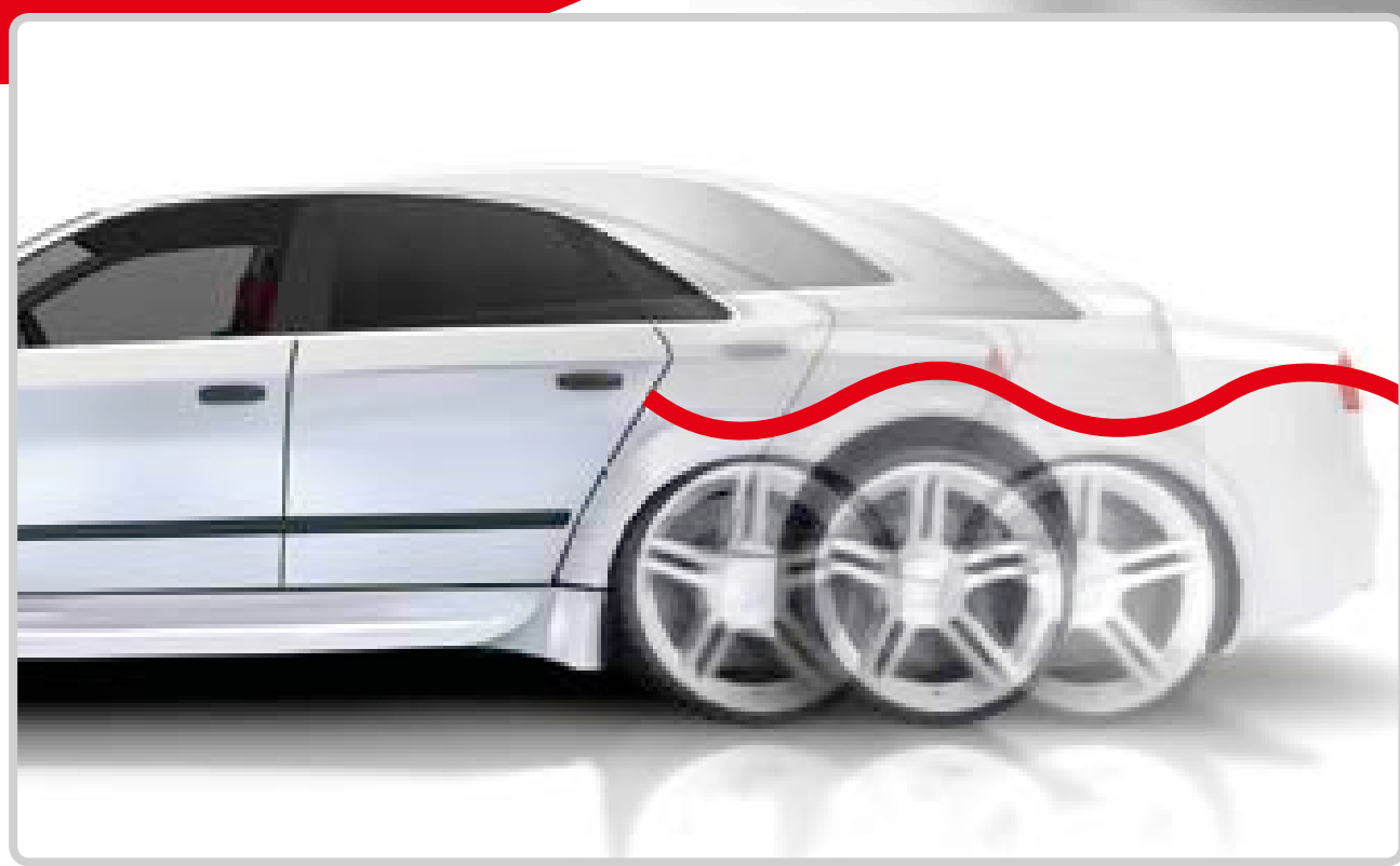
Pastiprinātas svārstības virsbūves