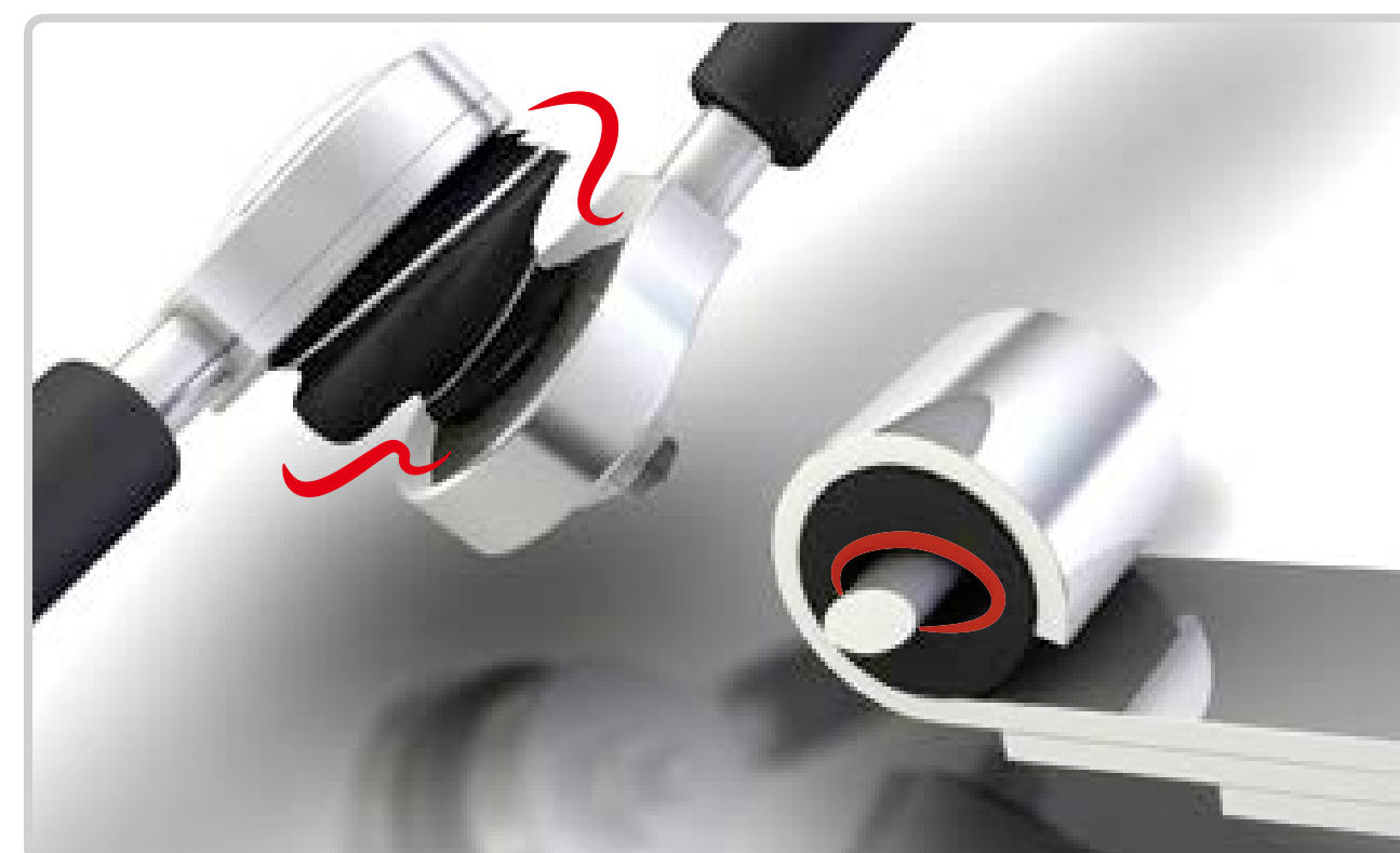
Izdiluši balsta šarnīri un gumijas-metāla bukses

(viegla eļļas kārtā ir nepieciešama amortizatora stieņa eļļošana)