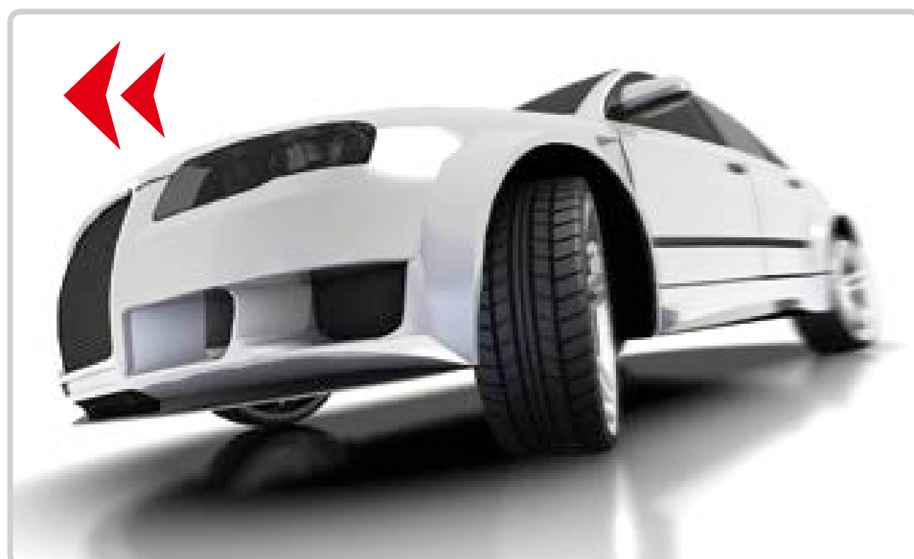
Slikta stabilitāte līkumos