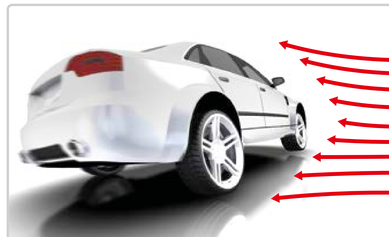
Augsta jutība pret sānvēju