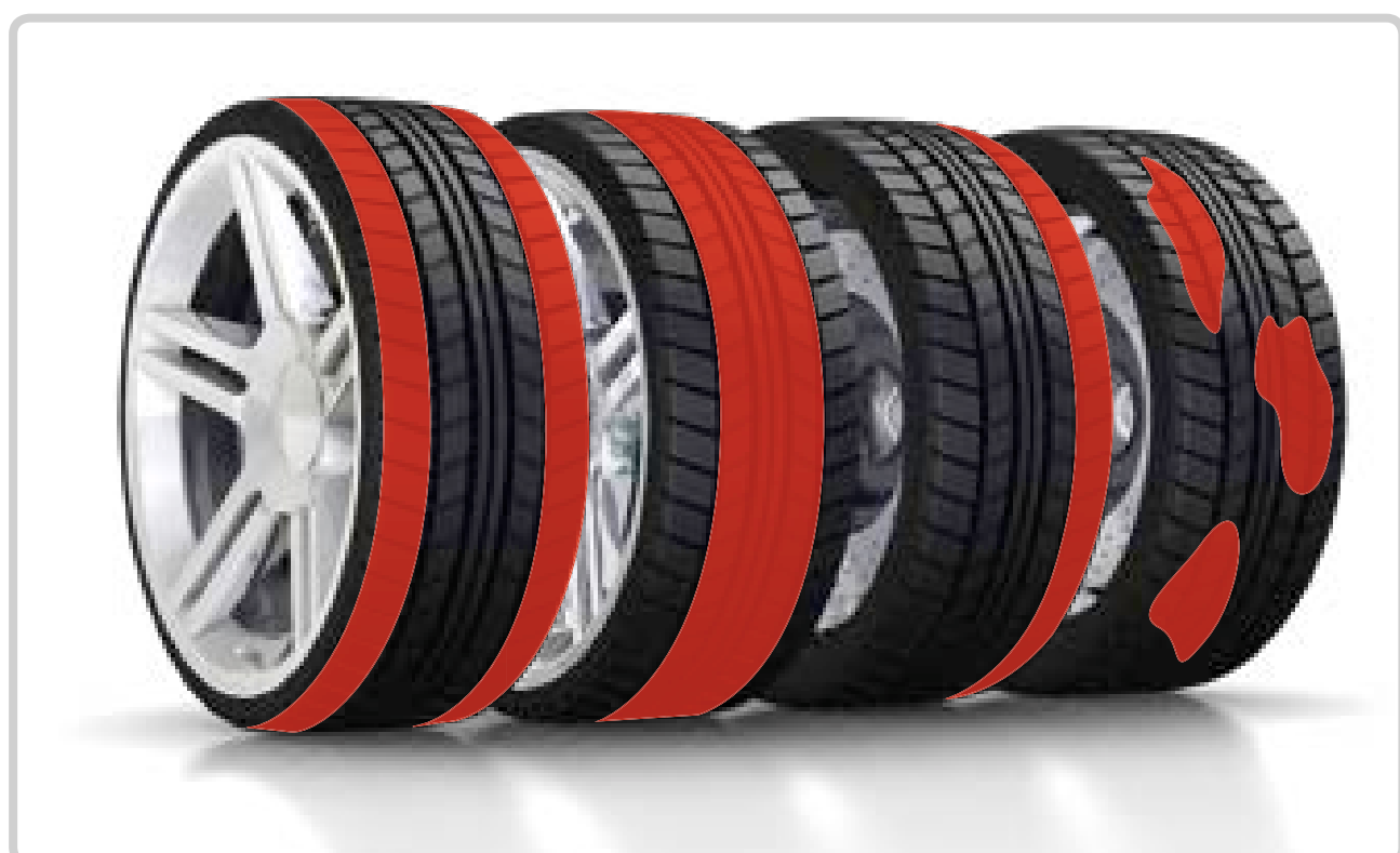
Nevienmērīgs riepu dilums: