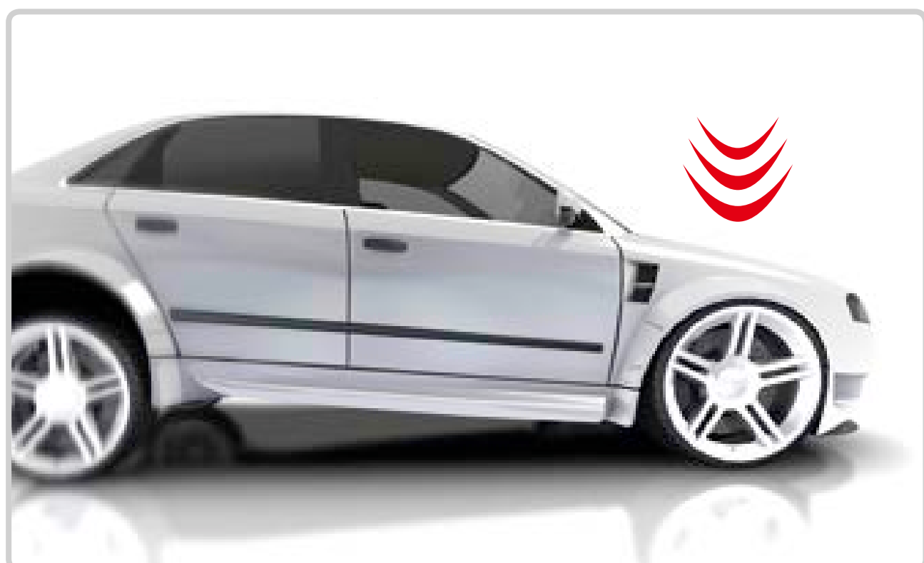
Automašīnas pārmērīga svēršanās uz priekšu bremzēšanas laikā