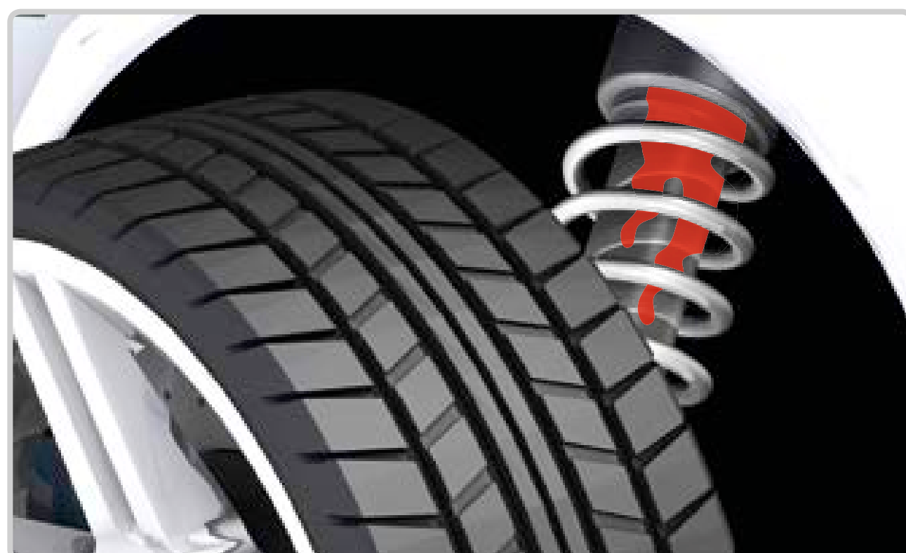
Eļļa uz amortizatora

(viegla eļļas kārtā ir nepieciešama amortizatora stieņa eļļošana)